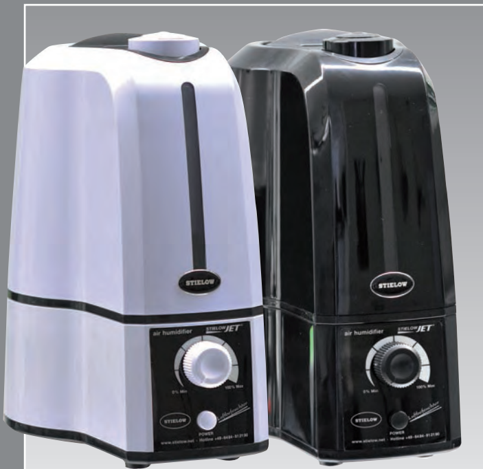
Lieferbar in der Farbe weiss, optional in schwarz.