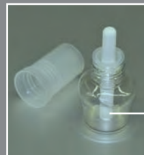
Duftfläschchen zum Einbringen von Duftstoffen