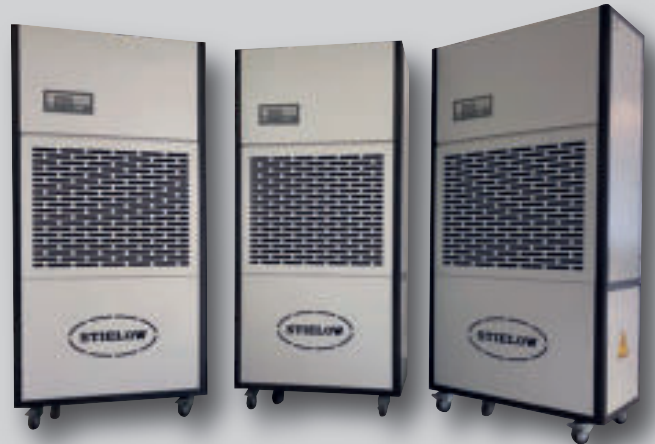
Gruppe AIRDRY 250 T, 350 T, 750 T