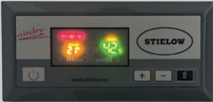
Digitale Steuerung für vollautomatischen Betrieb