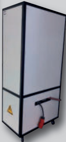
Ansicht Rückseite Schaltschrank